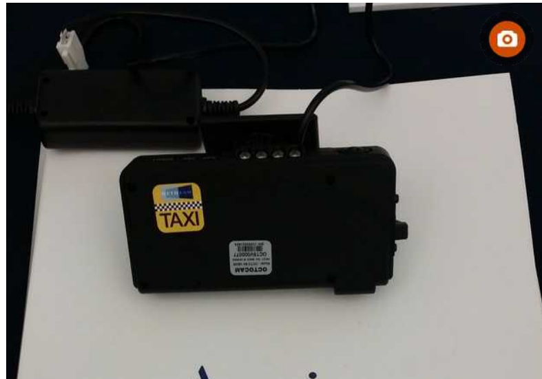
Sicurezza stradale, installate 200 telecamere su taxi romani

Redazione ANSA ROMA 14 OTTOBRE 2015 14:12