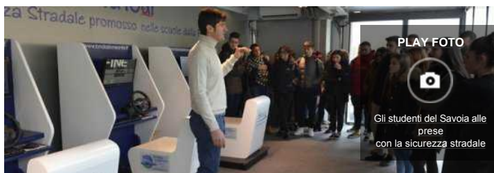
Gli studenti del Savoia alle prese con la sicurezza stradale

RIETI - I rischi legati alla distrazione al volante, gli effetti negativi dell'alcol sulla guida e le principali nozioni per gestire l'automobile in caso di sbandata o perdita di controllo per neve, ghiaccio o acquaplaning. Tutto completato da una serie di prove pratiche al simulatore di guida.